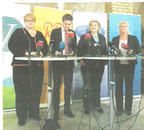
Vi håper at Høyre og deres samarbeidspartnere lar seg inspirere til å tilpasse også det norske lovverket til vår tids største utfordring, skriver artikkelforfatterne. Her Trine Skei Grande, Knut Arild Hareide, Erna Solberg og Siv Jensen.

Trenger kreativitet og mot Hovedutfordringen i klimapolitikken er mangel på hensiktsmessige politiske instrumenter. For å lage slike instrumenter trengs både kreativitet og mot – som da britiske