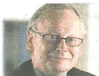
John Gummer Lord Deben leder, Committee on Climate Change